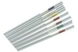
不同颜色CBS细管 编号: 019046(灰)/019047(红) 019048(绿)/019049(蓝) 019050(黄)/019051(橙) 019052(白)