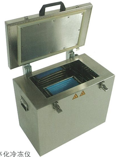
程序化冷冻仪 编号:007261