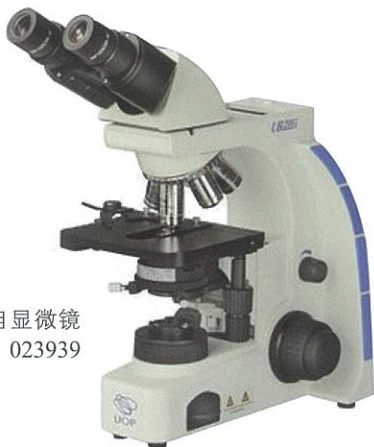
双目显微镜 编号: 023939