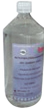
ACTIFISH鱼精液稀释液 编号:018274