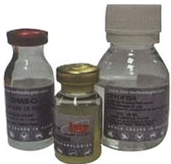
精液冷冻稀释液 编号:017295