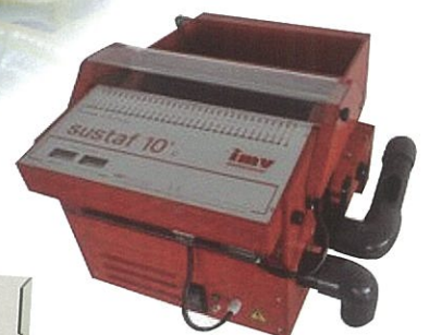
鱼卵筛选器 编号: 019520