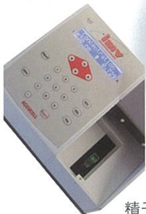
精子密度分析仪 编号 ACCUCELL: 014439 ACCUREAD: 019953